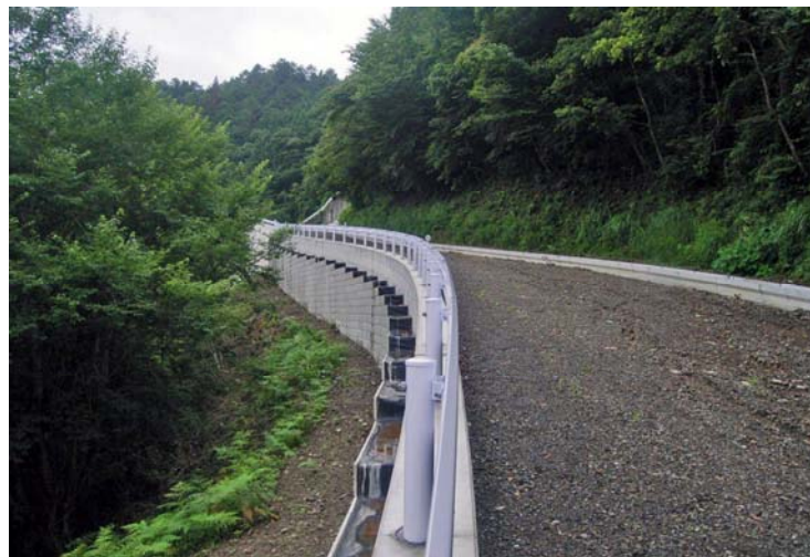
軽量盛土(FCB 工法)完成状況