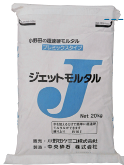
● ジェットモルタル 20kg/袋