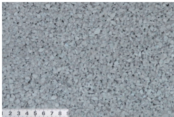
ポーラスクリート グレー