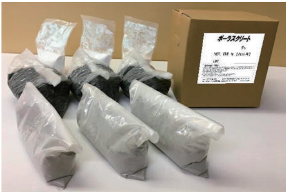
荷姿：ポーラスクリート グレー