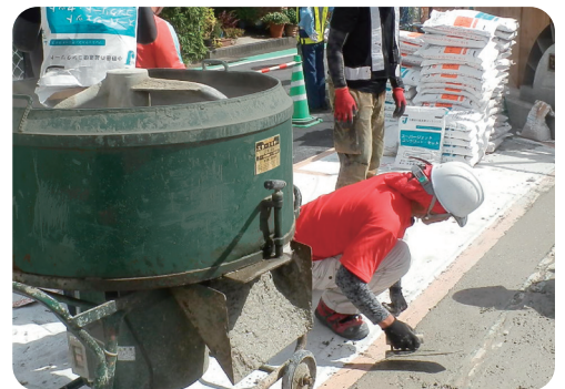
伸縮装置での使用例